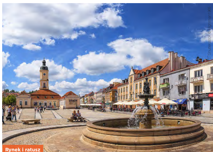
Rynek i ratusz

Najciekawsze obiekty udostępnione do zwiedzania to Aula Magna oraz kaplica pałacowa. Ta pierwsza została odrestaurowana w latach 90. XX w., a współczesne zdobienia nawiązują do baroku. Kaplicę odtworzono zgodnie z oryginałem z końca XVII w., czyli z czasów Stefana Branickiego (część sztukaterii to oryginał).