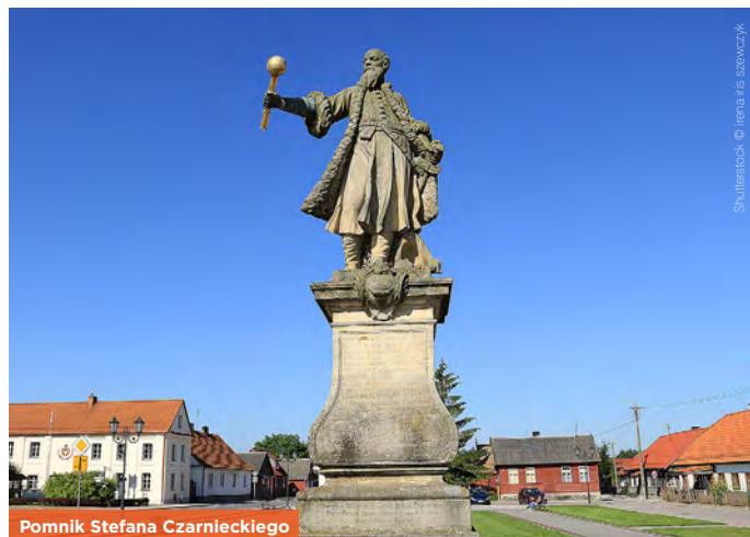
Pomnik Stefana Czarnieckiego

Nieco senny rynek na planie trapezu, z niską zabudową, powstał w XV w., a w XVIII stuleciu nadano mu barokowy charakter. Nad placem dominuje pomnik Stefana Czarnieckiego z 1764 r.