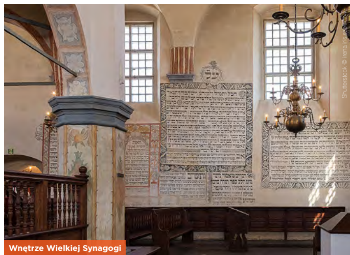
Wnętrze Wielkiej Synagogi

I Muzeum Kultury Żydowskiej; Tykocin, ul. Kozia 2, ☎85 718 16 13; wt.–nd. 10.00–17.30; 16/8 zł, sb. bezpł.