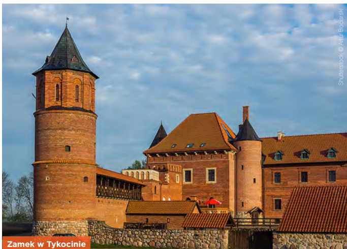
Zamek w Tykocinie

Tykociński zamek, położony przy starorzeczu Narwi, został zrekonstruowany na fundamentach XVI-wiecznego zamku królewskiego Zygmunta Augusta.