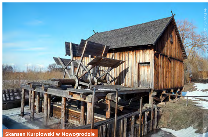
Skansen Kurpiowski w Nowogrodzie

📍 Skansen Kurpiowski; Nowogród, ul. Zamkowa 25, ☎86 217 55 62, http://www.skansen.kurpie.com.pl/skansen_nowograd ; w sezonie pn.–pt. 9.00–17.00, sb. i nd. 10.00–17.00; 7/5 zł, pn. bezpłat., w pn. zwiedzanie tylko od zewnątrz.