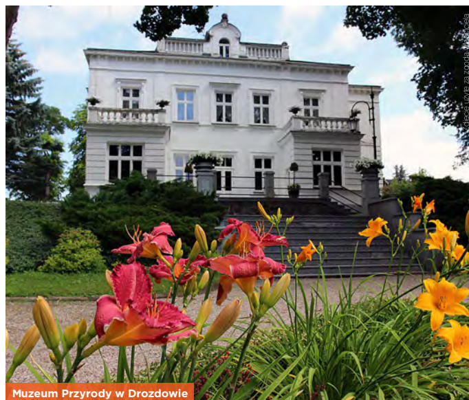
Muzeum Przyrody w Drozdowie

www.muzeum-drozdowo.pl; V–IX pn.–pt. 8.30–17.30, sb. i nd. 9.30–17.30, X–IV wt.–pt. 8.30–15.30, sb. i nd. 9.30–15.30; 9/7 zł, pt. bezpł.